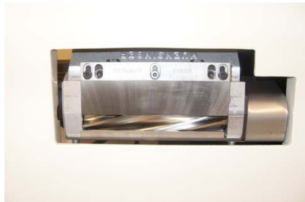
Mobile Teppichschermaschine TS 120 U Mobile Carpet shearing machine TS 120 U